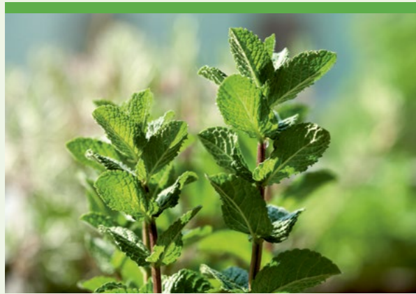
Minze: erfrischend gesund

Minze gehört nicht umsonst zu den beliebtesten Kräutern: Sie riecht erfrischend, wirkt heilend und schmeckt lecker. Schon die alten Römer schätzten Minze als Heilkräuter, Gewürz und Aphrodisiakum. Die Pfefferminze, die bekannteste Minz-Art, entdeckten die Briten um 1700, weltweit gibt es über 30 Sorten.