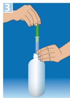
gewünschtes Volumen aufziehen