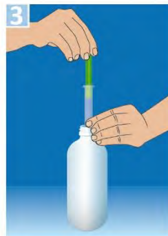
gewünschtes Volumen aufziehen